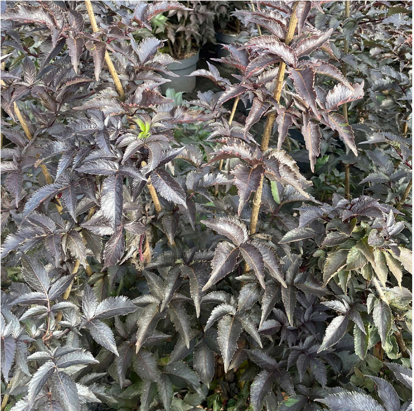
Dunkellaubige Säulen-Holunder 'Black Tower' C5 60 - 100 Liefergröße: 60 - 100 cm - Sambucus nigra 'Eiffel 1' Black Tower

Der Dunkellaubige Säulen-Holunder 'Black Tower' hat eine außergewöhnliche dunkle Laubfarbe zu bieten. Zudem hat er große, weiße Blüten dolden, aus denen später die köstlichen und sehr gesunden Fliederbeeren heranreifen. Die Pflanze hat einen schmalen und kegelförmigen Wuchs und ist daher hervorragend für kleine Gärten und engere Passagen geeignet.