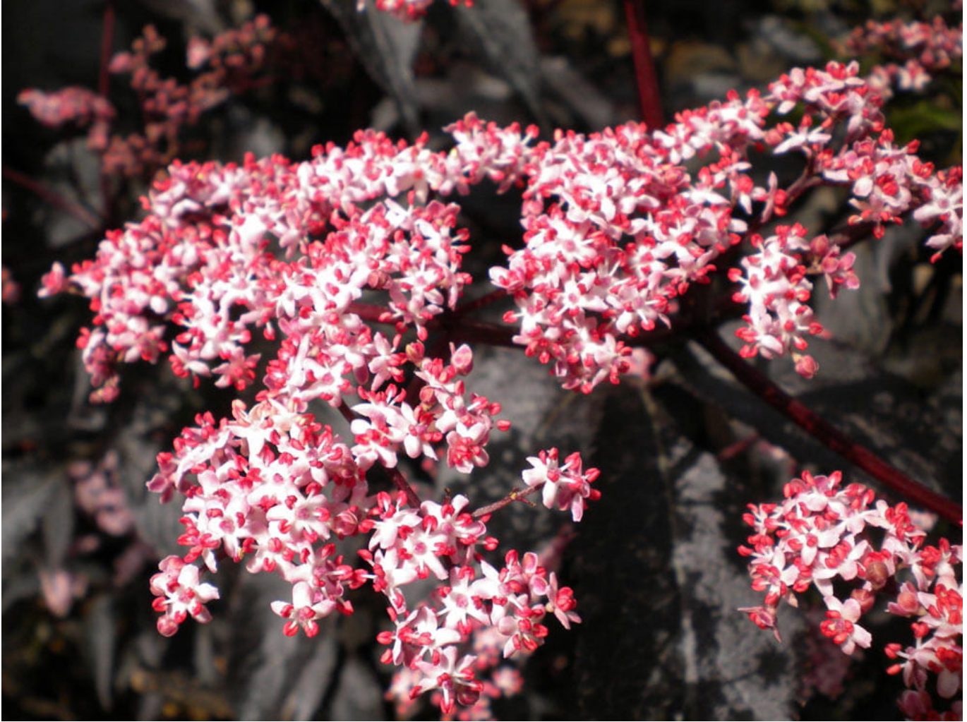
Fliederbeere 'Black Beauty' • Sambucus nigra 'Black Beauty'

Überprüfe deshalb die Eigenschaften und die tagesaktuellen Preise im Onlineshop unserer Partner.)