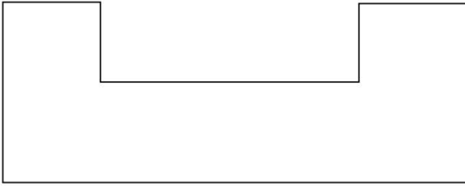
Umriß des Beetes zeichnen